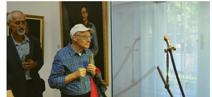
Право богатство артефаката