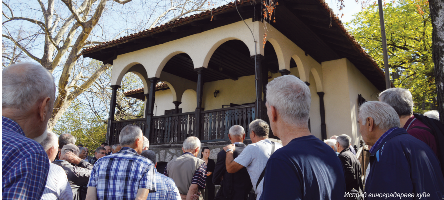
Испред виноградареве куће

У СЛИЦИ И РЕЧИ Новобеоградски пензионери у посета Задужбини Карађорђевића на Опленцу