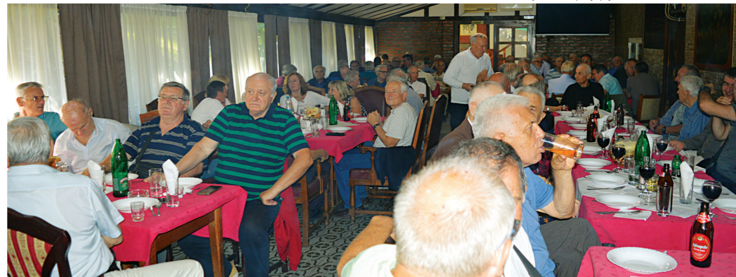
Заједнички ручак у ресторани „Језеро“

Тридесет девет чланова породице Карађорђевић, међу којима и пет владара, сахрањено је у крипти цркве. На почасним местима у цркви, у белим мермерним саркофазима, одвојено почивају војд Карађорђе и његов унук краљ Петар I ослободилац.