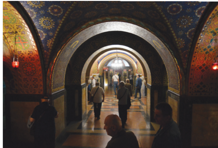
У крипти цркве почивају земни остаци чланова породице Карађорђевић