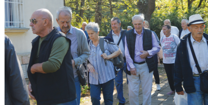
Сваки део објекта на површини од 142 хектара је део националне историје