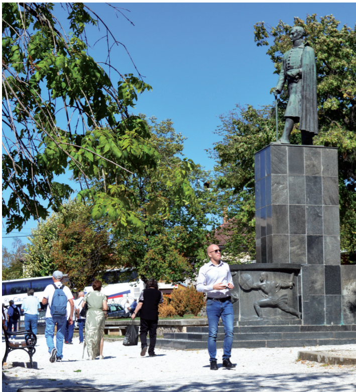
Споменик великом војду