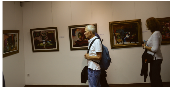
Изложба у Виноградаревој кући