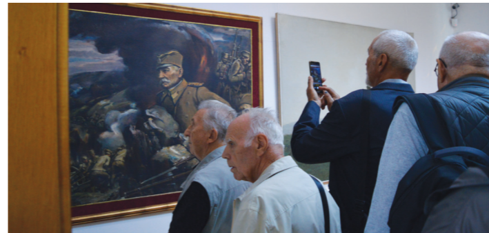
Вредни експонати привукли су пажњу учесника похода