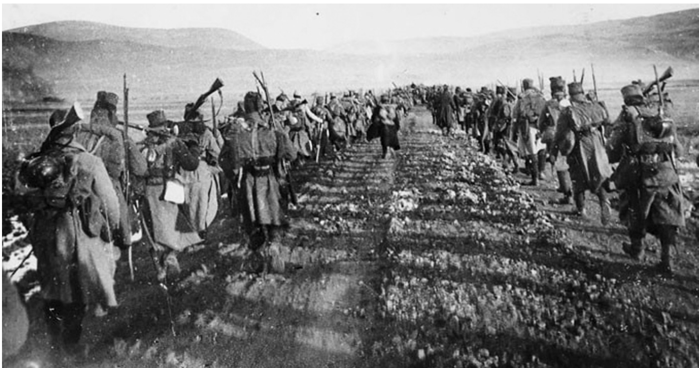
После повратка у своја места наступила је демобилизација

вијеће Словенаца, Хрвата и Срба, а хрватски сабор је потом прогласио раскид државноправних веза са Аустроугарском. Српска војска је 1. новембра ушла у Београд и одмах, упркос потреби за одмором, из политичких разлога наставила преко