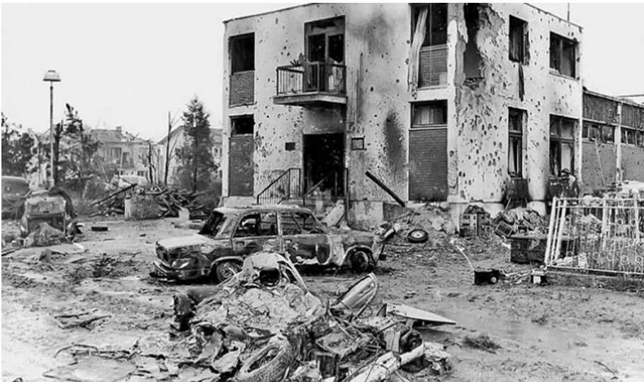
Рушевине све говоре

разбацује милијарде и милијарде долара кроз прозор за последице ратних сукоба који су уследили.