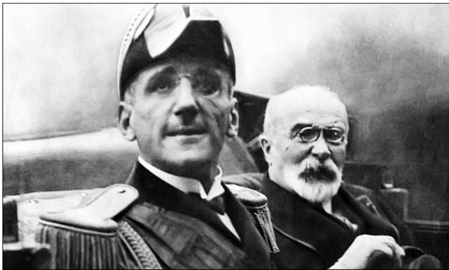
Александар Први Карађорђевић и Луј Барту 9. октобра 1934.

При повратку из Софије септембра 1934. када га је енглески посланик питао плаши ли се атентата рекао је: „Никад на то нисам ни помислио док сам био у Бугарској. Таква ми се ствар пре може догодити у Француској." Тада је и написао тестамент, који је отворен после убиства