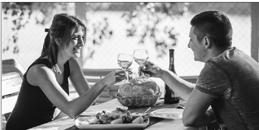
Свако свој јеловник

Математички модели били су окосница овог истраживања, а притом су коришћени прикупљени подаци о здравственим навикама жена и мушкараца. Резултати су показали да жене у просеку имају више