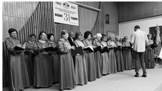
У културно-забавном програму учествовао је и хор „Учитељска лира“

Стање у Војној болници Ниш из дан у дан се побољшава, јер држава је почела да осавременује Војну болницу, која је најстарија здравствена институција на југу Србије, јер је формирана пре 145. године. Неопход-