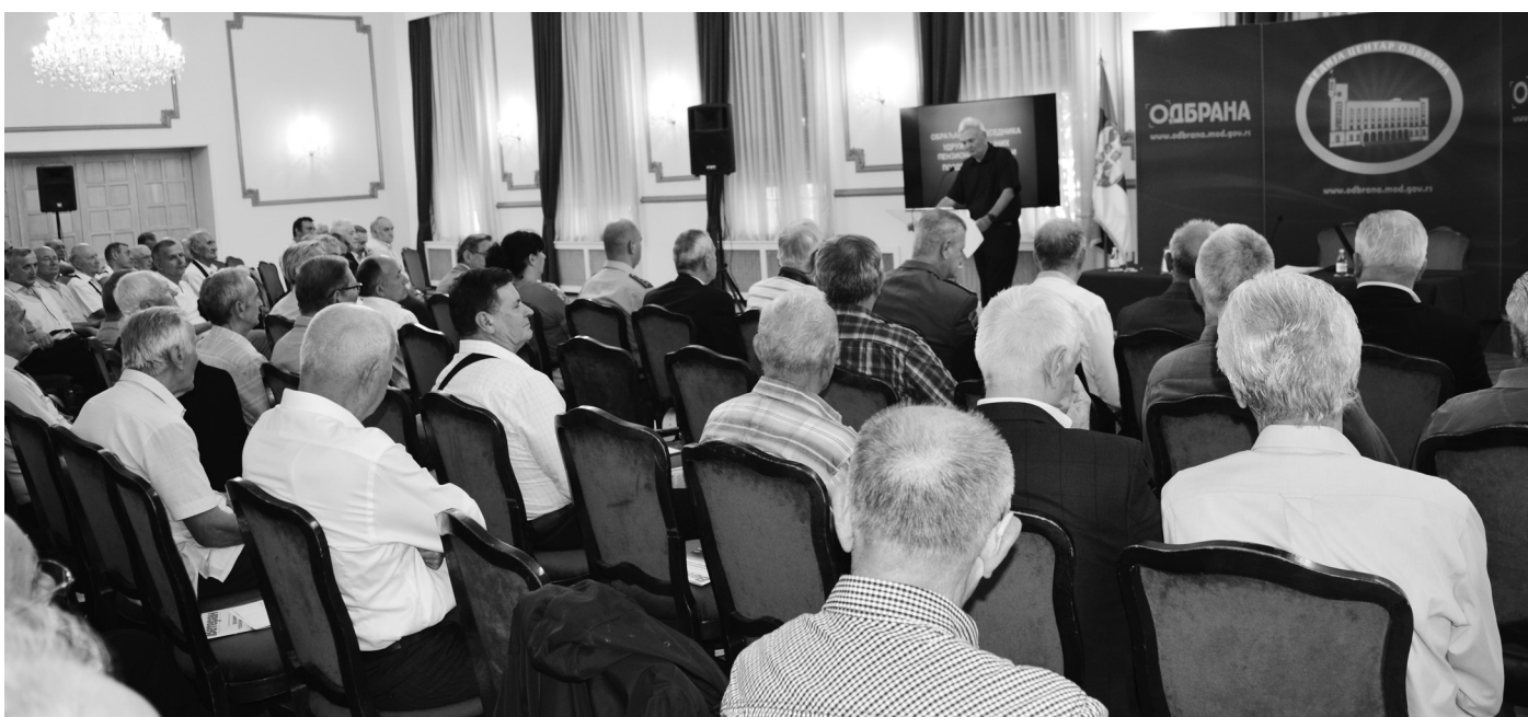
Седнице годишње Скупштине су места где се доносе важне одлуке за рад УВПС

Када се саберу сви домети Удружења у минулих дванаест месеци, то говори о непрестаном, упорном и стваралачком раду органа и многобројним активностима, разгранатим и осмишљеним, у којима је учествовала већина чланова. Највећи проблем војних пензионера је невесела стамбена ситуација јер у годину дана није подељен ниједан стан.