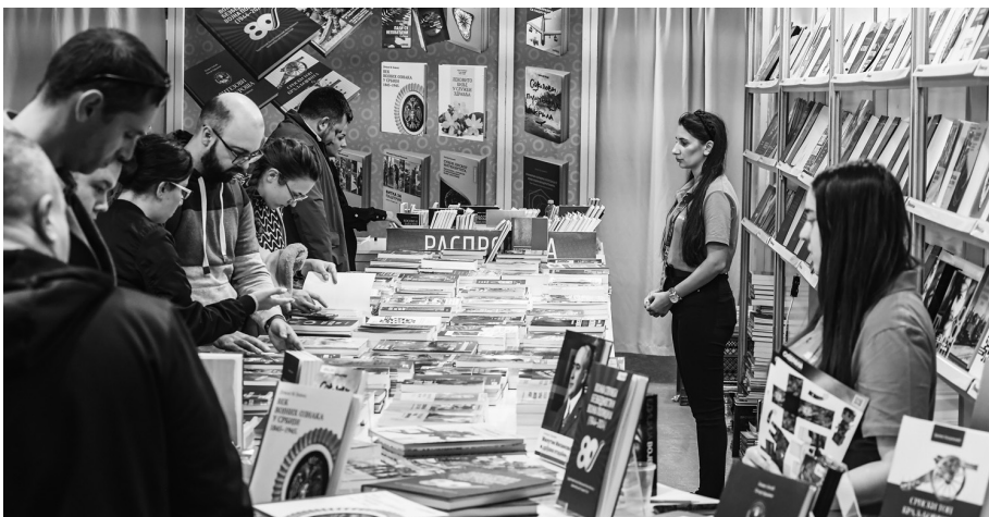
Штанд војног издавача био је веома посећен