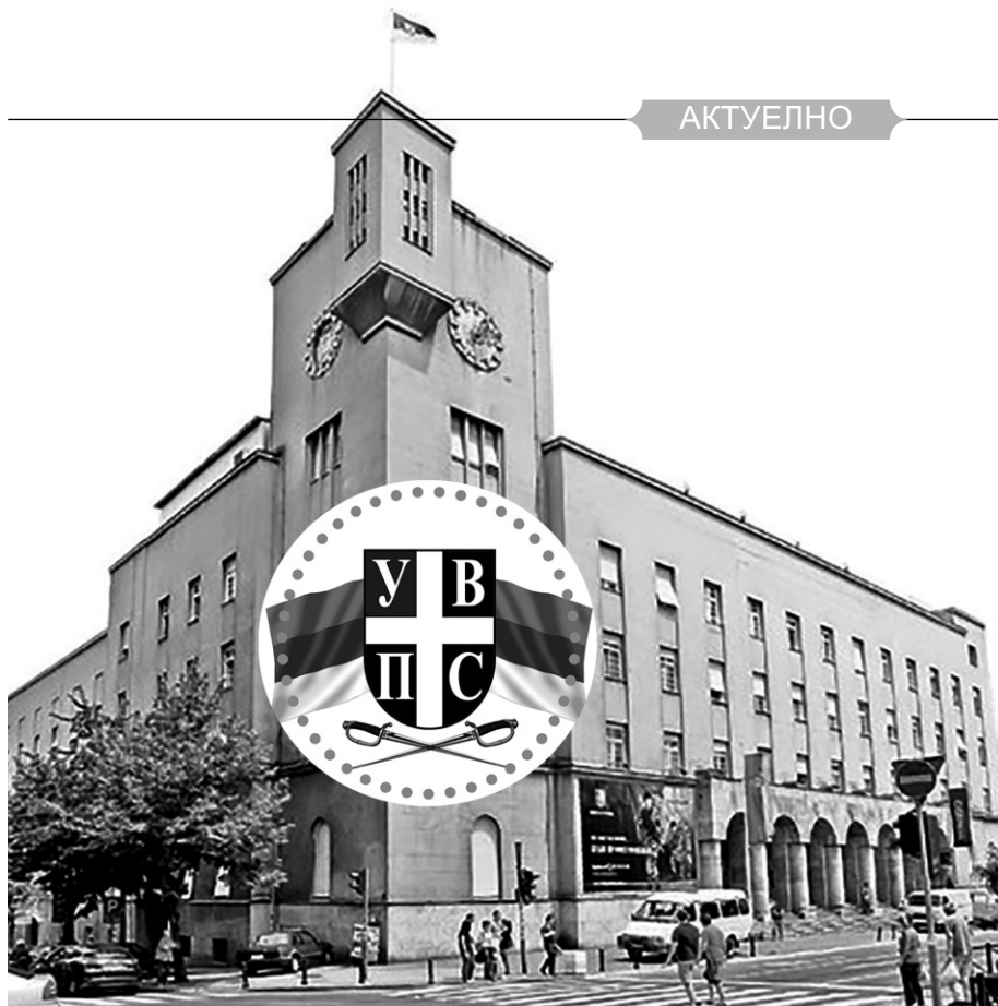
Дом Војске Србије у Београду седиште је УВПС

И поред проблема у протеклом периоду, Удружење је успело да се афирмише као незаобилазан чинилац и репрезентативни представник и заштитник статусних права, части, угледа и достојанства војнопензионерске популације. Након одређених проблема, не нашом кривицом, у протеклом периоду створени су услови да се позитиван однос, након дужег времена, стагнације прошири и на остале институције система.