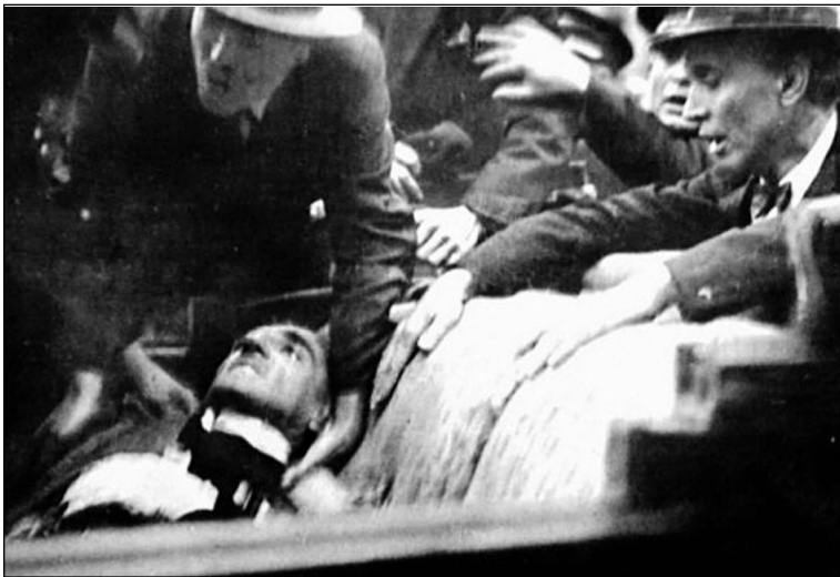
Краљ Александар непосредно после атентата