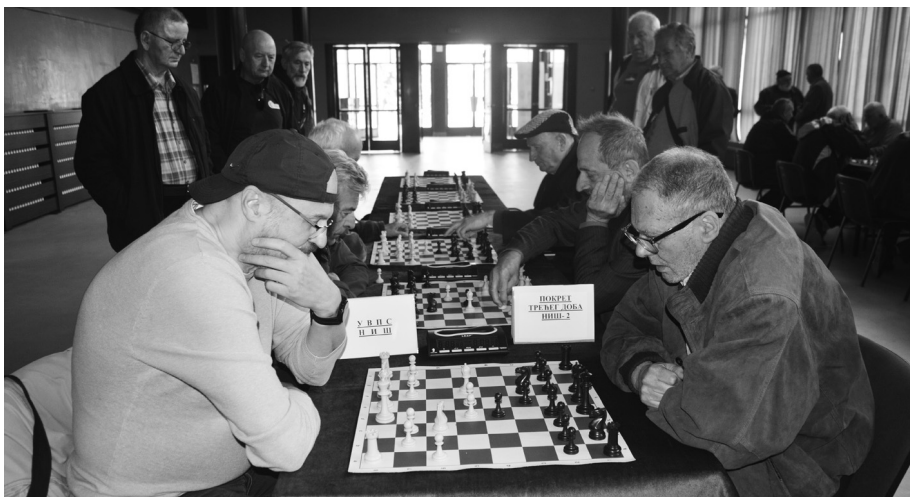
И шахом се често употпуњавају дневне активности војних пензионера

По одлуци ГлОд Скупштине УВПС чланарина износи 0,2% (редовна чланарина 0,12% а 0,08% за средства социјалне и хуманитарне помоћи) од нето пензије корисника војне пензије који је члан УВПС. Обрачун и уплату чланарине врши Републички фонд ПИО при обрачуну пензије. Обрачун се доставља ИзОд сваког трећег у месецу за претходни месец. Обрачун садржи преглед чланова УВПС за које се врши обрачун чланарине и износ чланарине за