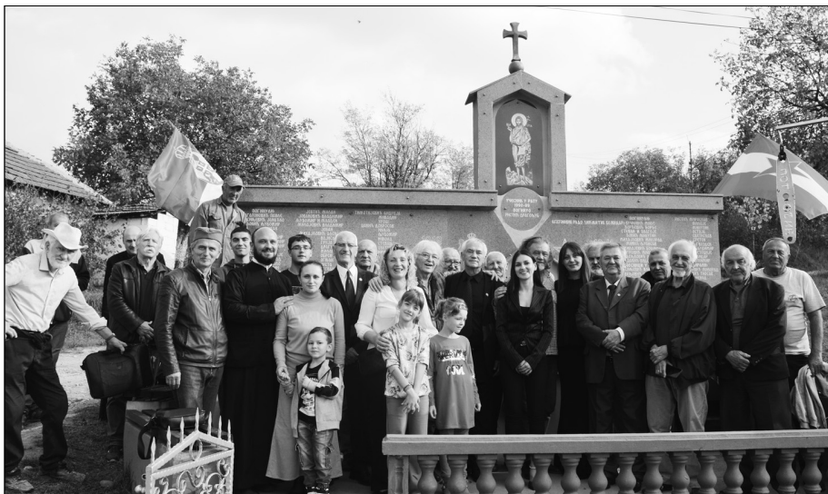
Заједнички снимак пред велелепним спомеником

У топличком селу Поточић, недалеко од Прокупља, 31. октобра организована је комеморативна свечаност поводом петогодишњице откривања Спомен-чесме са гранитним спомеником на коме су уклесана имена 124 мештана у Првом, Другом и ратовима из деведесетих година прошлог века. На црвеном споменику, који симболизује крв пролиvenu за слободу отаџбине, споменику ширине пет и висине пет метара су још уклесани грб Краљевине Југославије, српска рамонда, звезда петокрака и часни крст. При врху је икона Светог Јована, најчешће славе Поточићана.