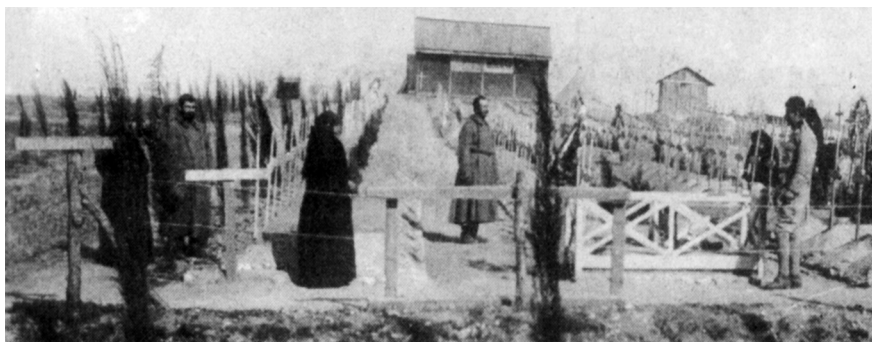
У Југословенску државу Србија је уградилa животе 402.435 војника и 845.000 цивила

У југословенску државу Србија је уградилa огромне жртве. Податак од 1.247.435 изгубљених живота, од чега 402.435 војника и 845.000 цивила, сачињен ради процене ратне штета на Конференцији мира у Паризу, још увек није у потпуности проверен. Тачни подаци о губицима ни до данас нису познати. Постоје неке назнаке. Војни архив је тако пописао имена скоро 282.000 погинулих и умрлих лица. Процене настале на основу анализа броја становника пре и после Првог светског рата говоре да је у старим пределима било 313.500 становника мање, а у целој предратној Србији је недостајало око 525.000 људи. Када се урачуна просечан демографски раст из претходног периода, добија се