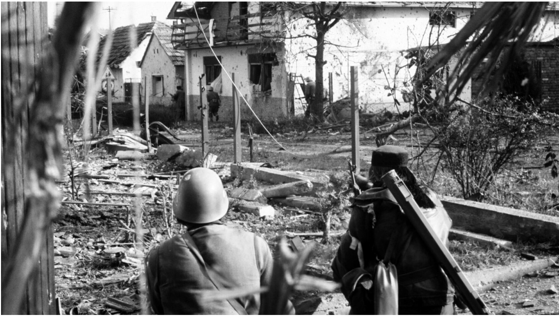
Ратови вођени деведесетих година донели су многе невоље