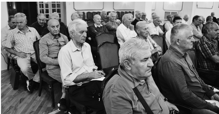
Војни пензионери су заинтересовани за све оно што им може побољшати живот

сује начин решавања стамбених потреба корисника војних пензија.