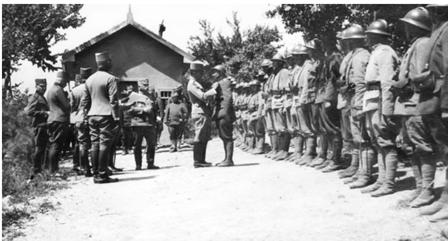
Регент Александар одликовао је 1918. добровољце – припаднике Југословенске дивизије

С лом Русије и нестанак Источног фронта омогућили су Немачкој да концентрише своје снаге на Западном фронту и покуша да офанзивама на њему реши судбину рата, пре доласка америчких трупа у Европу у пресудном броју. Стога су почетком 1918. године погледи српске владе били усмерени ка западу, како у војном тако и у дипломатском погледу. Политичке перспективе, чак и са претпоставком да војне буду повољне, постале су забрањивајуће након изјава водећих савезничких државника које су подразумевале опстанак Аустроугарске. Међутим, до друге половине 1918. године ситуација се из корена изменила. Неуспех немачких офанзива се преобразио у савезничку надмоћ на Западном фронту. Одбијање