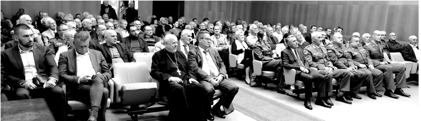
Сала Дома ВС у Нишу била је тесна за све оне који су хтели да дођу

Просторије које користи нишка организација УВПС отворене су за све оне којима је потребна помоћ у виду правног савета или у формирању докумената за остваривање одређених права. Дом ВС у Нишу место је које свакодневно походи више корисника војне пензије. Остварени резултати пропорционални су уложеном труду.