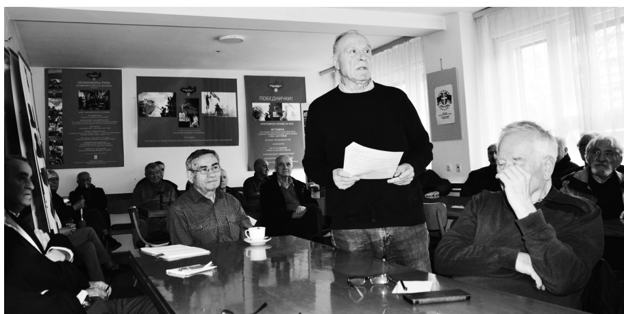
Више тема заокупило је пажњу делегата

На периферији главног града, уз ауто-пут Београд Загреб, простира се насеље Бежанијска коса које је једно од млађих, ако је реч о времену изградње. На том простору је Министарство одбране интензивно подизало зграде, тако да су створене компактне целине вишеспратница у којима су додељивани станови активним и пензионисаним припадницима система одбране. И тако, за разлику од неких других делова Новог Београда, у Месној организацији војних пензионера „Бежанијска коса“ су млађе старешине.