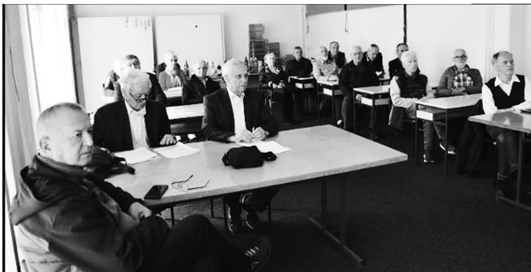
Све је мање млађаних војних пензионера