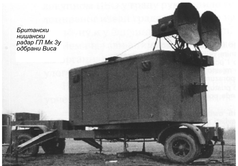
Британски нишански радар ГЛ Мк 3у одбрани Виса

године. У завршним операцијама за ослобођење земље, карактеристична је организација ПВО на Сремском фронту која је имала све одлике комбиноване ПВО и састојала се из: ПВО у позадини непријатеља, ПВО на фронту и ПВО на слободној територији.