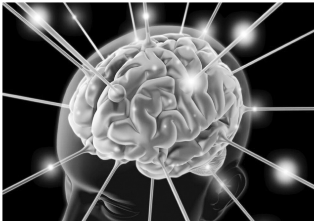
Мозак је и даље велика непознаница

Мозак не обрађује слике као камера, он користи претходно знање, обрасце и очекивања да „попуни празнине“, а када се суочи са нејасним или контрадикторним информацијама, бира највероватније објашњење, чак иако је погрешно.