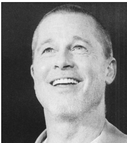
Бред Пит је имао бројне корекције, кад је био млађи.

Навела је и пример глумца Бреда Пита, који је имао бројне корекције, кад је био млађи и сад кад је ушао у шездесете године, а оживље од акни је све кориговао да се уопште не виде. Све те корекције су у