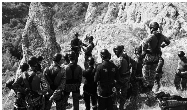
Обука у верању веома је захтевна