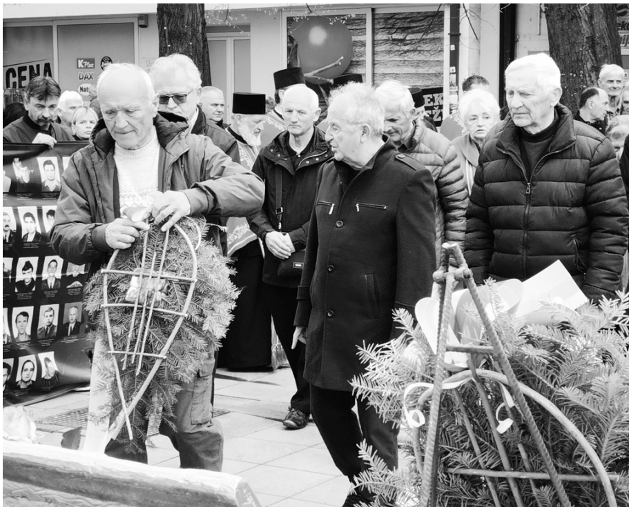
Делегација Градског одбора УВПС приликом полагања венца

У Краљеву су 24. марта полагањем венца и парастосом обележене 27 године од почетка НАТО бомбардовања СРЈ, код споменика Краљевчанима погинулим у ратовима на простору бивше СФРЈ од 1991-1999. године. Споменик се иначе налази испред Градске куће и на њему су уклесана имена 77 Краљевчана који су изгубили животе у тим ратовима. Од овог броја 41 Краљевчанин је погинуо током НАТО агресије а 36 на просторима бивше СФРЈ почетком деведесетих.