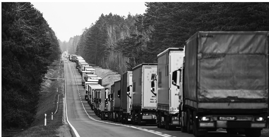
У раселјавању материјалних резерви учествовали су камиони из пописа

ва за ваздухопловство НАТО-а. А на месту лоцирања тих резерви формирани су нови формацијски састави, такозвана пољска складишта, у потпуности организована за ефикасан и непрекидан рад.