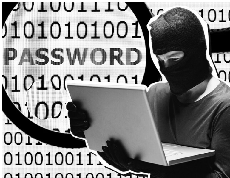
Хакери покушавају да се домогну важних података

Група међународних стручњака за сајбер безбедност успела је средином марта да приступи фолдерима на серверу руске хакерске групе. На серверима су пронашли доказе да су руски хакери прикупљали податке са имејл адреса из три