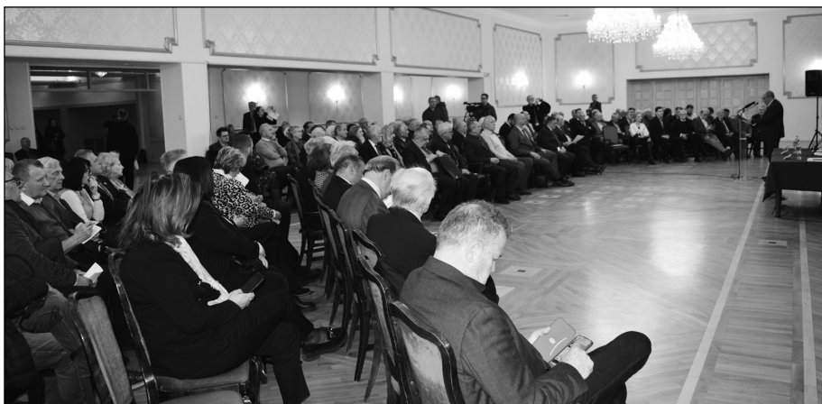
Скупу је присуствовао велики број експерата