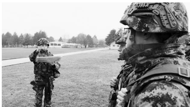
Девојке ће служити само добровољно