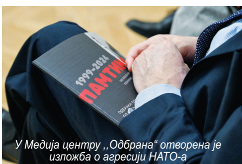
У Медија центру „Одбрана“ отворена је изложба о агресији НАТО-а