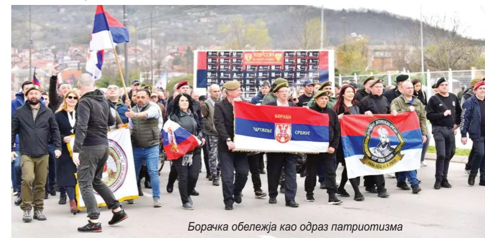
Борачка обележја као одраз патриотизма