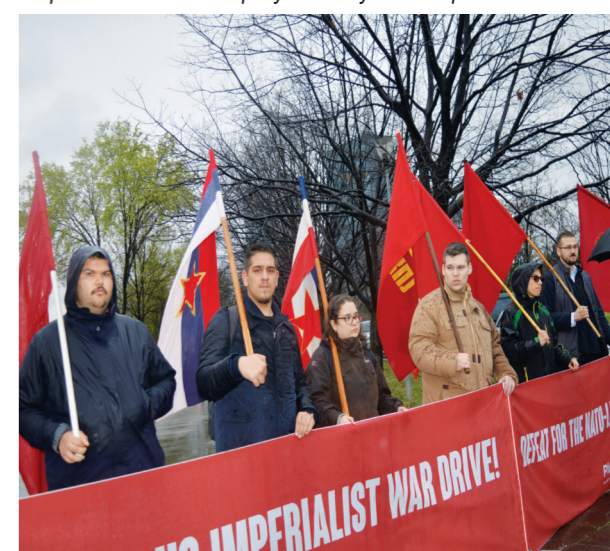
На ушћу су се могла видети и обележја негдашње државе