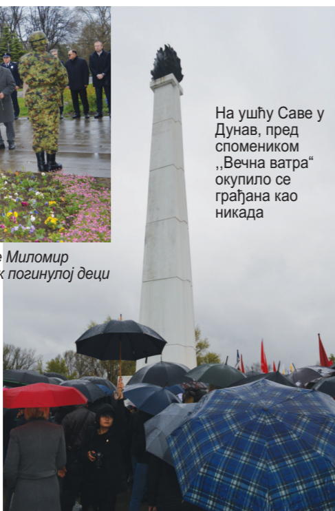
На ушћу Саве у Дунав, пред спомеником „Вечна ватра“ окупило се грађана као никада