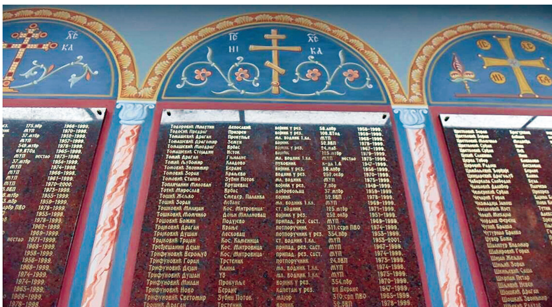
На плочама су уклесана имена 1.139 нових косовских јунака, припадника наше војске и полиције који су од 1998. до 2003. године пред олтар слободе Србије принели своје животе

Дан сећања на stradale у агресији НАТО-а на Србију (СРЈ) и 25 година од почетка бруталног бомбардовања суверене земље обележен је комеморативним скуповима широм Србије, у бројним градовима и општинама, у командама, јединицама и установама Војске Србије, и полагањем венаца крај спомен-обележја страдалима у одбрани отаџбине.