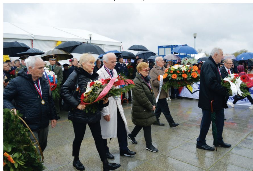
Полагање венаца на Споменик „Вечна ватра“