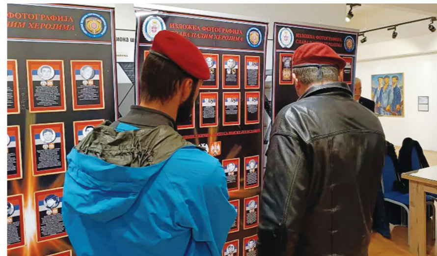
Ни киша није могла да спречи родољубе да одају пошту ратним друговима и пострадалим цивилима