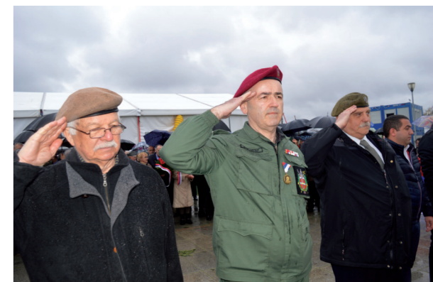
Почаст погинулим саборцима