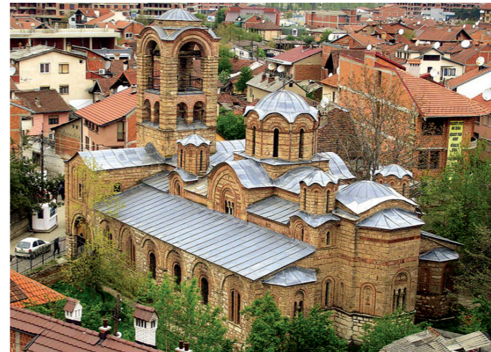
БОГОРОДИЦА ЉЕВИШКА темељно обновљена 1306/7. године