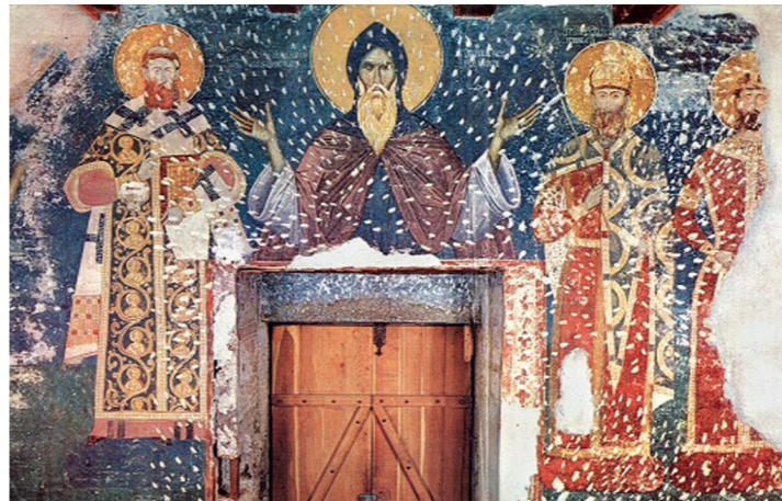
Свети Сава, Симеон-Стефан Немања и краљ Стефан Првевенчани око 1310. године

ка, који су већином били канонизовани као Свети. Лоза обухвата 22 фигуре, почев од Стефана Немање до Уроша Нејаког, сина Душана Силног. Више „красних врата“ којима се улази у брод храма насликани су краљ Стефан Дечански и цар Душан, задужбинари места овога.