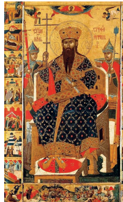
Икона: Стефан Дечански са житијем, XVI век