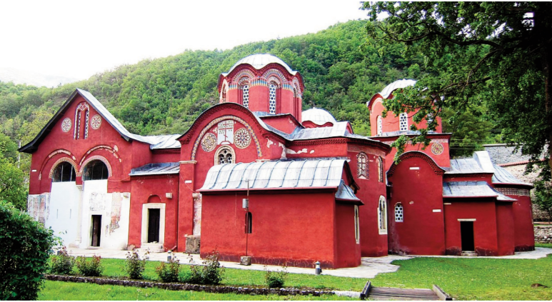
ПЕЊКА ПАТРИЈАРШИЈА са четири цркве грађене између 13. и 14. века

Косово и Метохија је митска тачка наше историје. Сваки историјски догађај постаје значајан када добије симболику. Видовдан је необична историјска прича о жртвовању, о првенству виших над нижим циљевима, царство небеско за које се у митолошки одредили кнез Лазар. Видовдан Србима даје необичност као народу, достојном легенде.