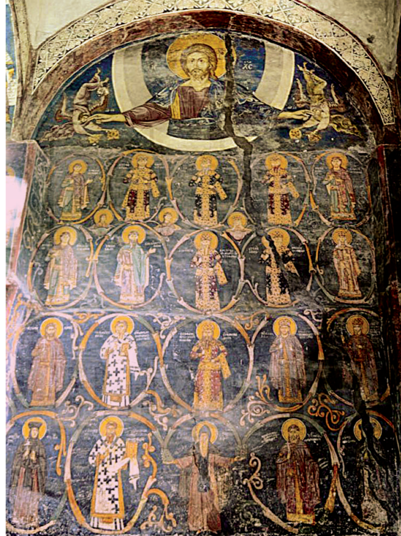
Лоза Немањића, приправа Пењке патријаршије, са двадесетак портрета од Немање до цара Душана

Уништен је и оштећен 5.261 надгробни споменик на 256 српских православних гробаља, док на више од 50 гробаља не постоји ниједан читав споменик. Из српских гробова „чак су ископане и разбијане кости“, док су гробаља „претворена у депоније, неприступачна су, зарасла у коров и шипраже“.