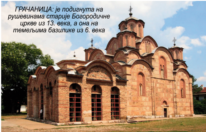
ГРАЧАНИЦА: је подигнута на рушевинама старије Богородичне цркве из 13. века, а она на темељима базилике из 6. века

Од 1999. године на Космету је од уништено 150 српских цркава и манастира, од којих чак 61 имају статус споменика културе. Уништено је и покрадено више од 10.000 икона, црквено-уметничких и богослужбених предмета „који се увелико крме на светском илегалном тржишту антиквитета“.