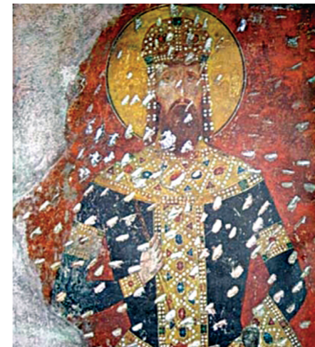
Ктитор краљ Милутин, фреска (детал) око 1310.

ка, који су већином били канонизовани као Свети. Лоза обухвата 22 фигуре, почев од Стефана Немање до Уроша Нејаког, сина Душана Силног. Више „красних врата“ којима се улази у брод храма насликани су краљ Стефан Дечански и цар Душан, задужбинари места овога.