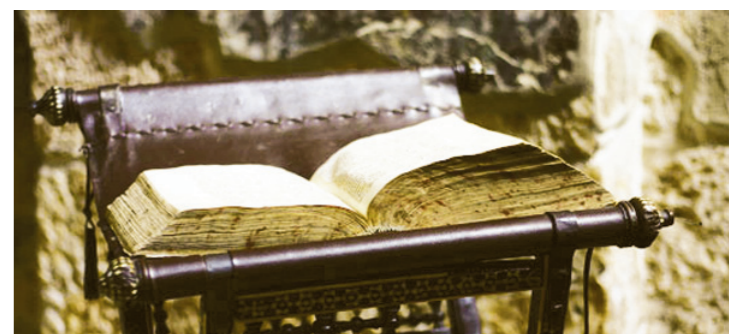
Збирке рукописа старих штампаних књига од 14 до 19. века

претворена у женски манастир. Пењка Патријаршија је у непосредном надлештву Српског православног патријарха у Београду, где је данас средиште Патријаршије.