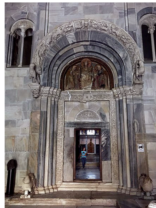
Монуменална фасадна на улазу у манастир