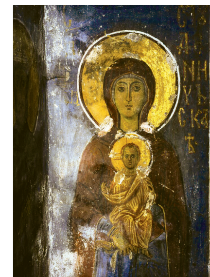
Богородица Студеничка са Исусом