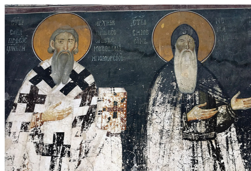
Свети Сава и Симеон на једној од фреска