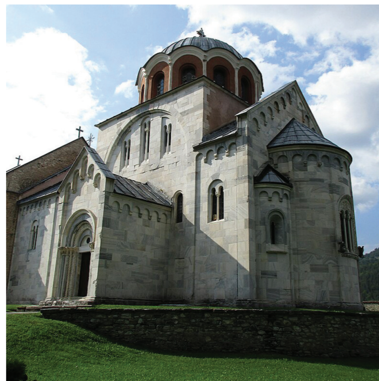
Светска баштина Унеска

Манастир Студеница је мушки манастир српске православне цркве. Основао га је 1186. године српски жупан Стефан Немања. Године 1206. на место игумана долази принц Растко — у монаштву први архиепископ српски, Свети Сава — и под његовим старатељством Студеница постаје културно, уметничко, болничко и духовно средиште српске државе.