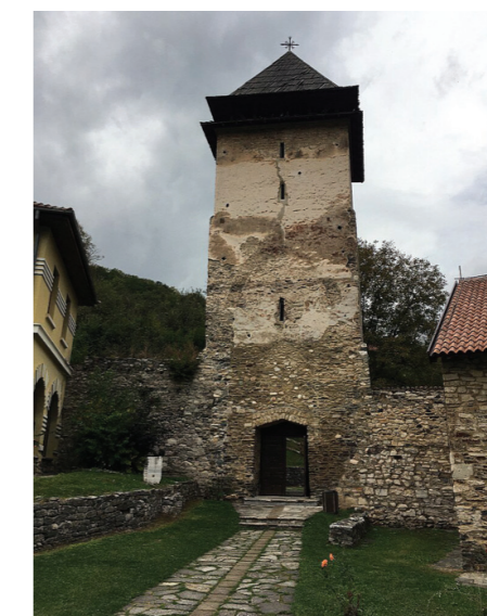
Кула манастира Студеница