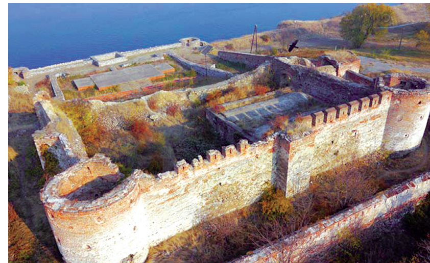
Из овог угла долази до изражаја лепота тврђаве

Унутар тврђаве су откривене и многе грађевине и објекти различите намене, за њену посаду, као на пример барутана и магацини, лагуми, хамам, џамија... Остаци моћних, чврсто зиданих водо-инсталација, бунара и канала