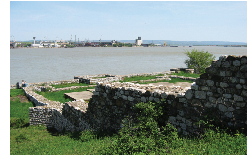
Део остатака тврђаве конзервиран је