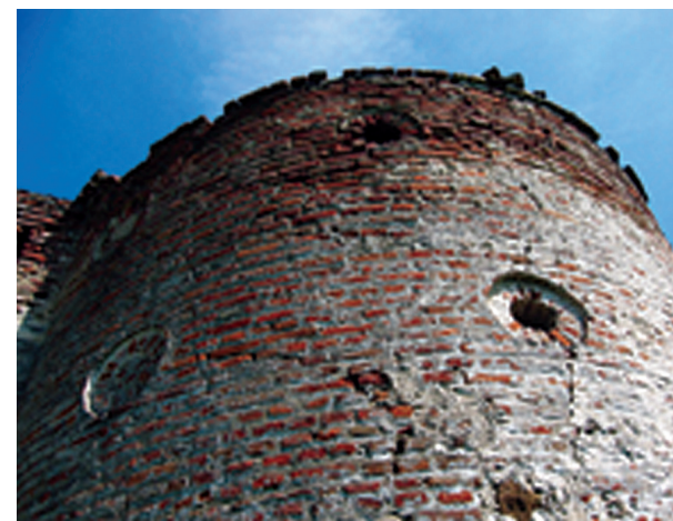
На кули су уочљиви отвори за оружје

О ва средњовековна тврђава, укупне површине око 18 хектара, на самој обали Дунава, на уласку у град Кладово, из западног правца, налази се тврђава „Фетислам“. Чине је две фортификационе целине, Велико и Мало утврђење - Кастел, који је инкорпориран у већу, млађу тврђаву. Велика тврђава – Велики град, како се још назива, највећих димензија 480 x 260 м, у основи је полигонална, касносредњовековна, бастиона тврђава, са шест полигоналних кула-бастиона, повезаних бедемима, са зиданим пролазима, окружена воденим ровом, са контраескарпом ширине до 30 м и са покретним мостовима, испред све три главне капије. Изнад лучно засведених, главних улаза, Дунавске, Ороспи и Варош капије, током последње обнове и реконструкције, постављени су почасни натписи, којима се велича султан Махмут II (1818 – 1839), у време када тврђава добија садашњи изглед.