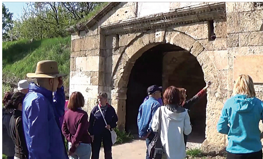
Путници намерници из целог света посеђују „Фетислам“