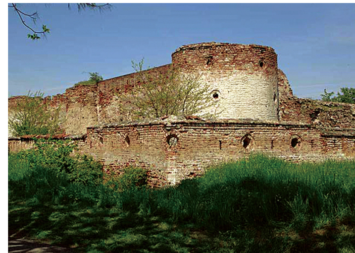
Зуб времена оставио је трагове