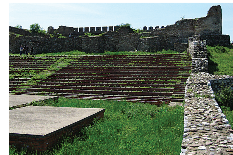
Место за већа окупљања и приредбе

за водоснабдевање града и тврђаве, могу се и данас видети оближњем залеђу (Буторке).