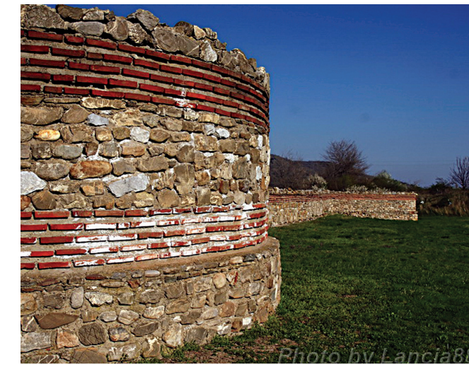
Неке целине су у потпуности обновљене