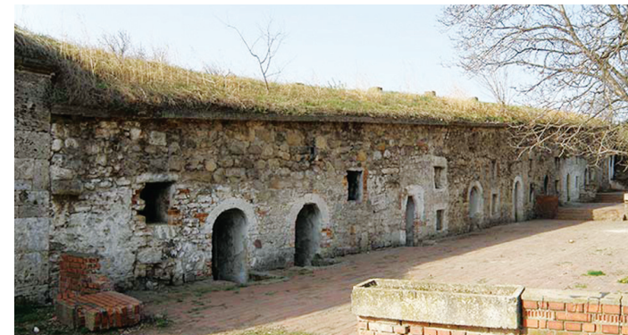
Стамбени део тврђаве