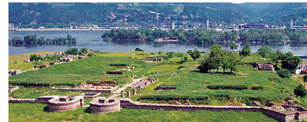
Поглед према Румунији

(Текст: Народни музеј у Београду - Археолошки музеј Ђердапа)