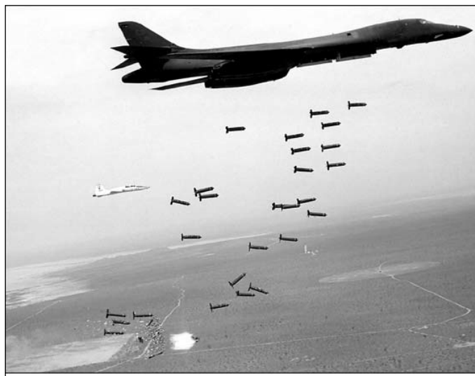
Зар после оваквих злодела НАТО-а да слаavimo Северноатлантски савез

Одлука о чланству у НАТО-у није само војно-техничко и формално-правно питање, већ крупно уставноправно питање које се тиче сваког грађанина, то јест суверенитета и територијалног интегритета земље. Једини носиоци суверенитета, по уставу из 2006. године су грађани. Само сви грађани на референдуму могу одлучивати о том питању.