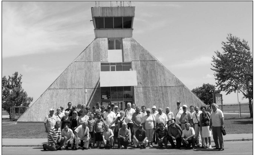
Са домаћинима у Ваздухопловној академији

Новосадски ветерани пилоти и падобранци у посети Вршцу