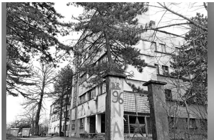
Зграда прве пилотске школе у Панчеву

имали у саставу Приморског аеропланског одреда код Скадра, марта 1913. године. У Другом балканском рату формирано је јуна 1913. балонско одељење. Председник српске владе наредио је 16. марта 1914. Министарству војном „да се убрза снабдевање Србије извезбаним људима и добрим апаратима“. Међутим, средства су касно одобрена, тек јуна 1914. године, Србија је у рат ушла са скромним ваздухопловним снагама.