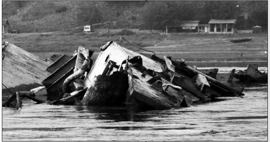
Потопљени немачки бродови увек „изроне“ при ниском водостају Дунава

Он додаје да има различитих историјских прича и извора и да на то обраћају пажњу људи који раде на овом пројекту, а истраживање ће рећи како ће се уопште