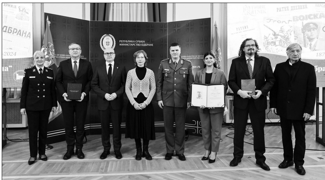
Представници Министарства одбране са добитницима признања