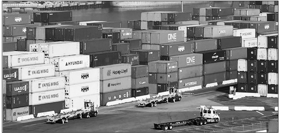
Луке чекају утовар робе

У протеклој години изградња новог светског поретка заснованог на начелима једнакости свих држава, нација и људи добила је нову снагу. Препознавање и поштовање мултиполарности постало је у прак-