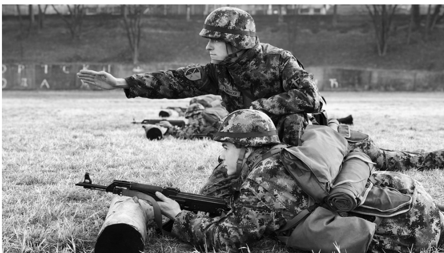
Очигледност обуке најбоље се манифестује на полигонима и вежбалиштима

Да ли вреди одличан стрелац, ако војник не може да потрчи или издржи напоре дужег марша? Или обратно – колико вреди војник који је физички способан,