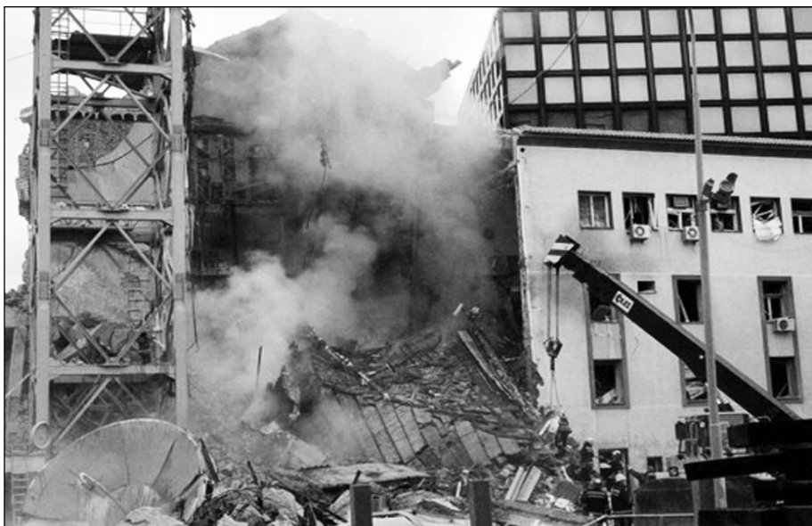
Бомбардовање зграде РТС био је злочин над злочинима

је пропагандна машинерија НАТО-а и западних земаља цензурисала објављивање са места злочина.