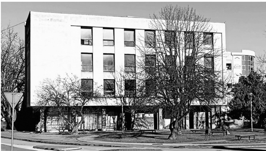
Дом војске у Шапцу годинама је запустен и без садржаја