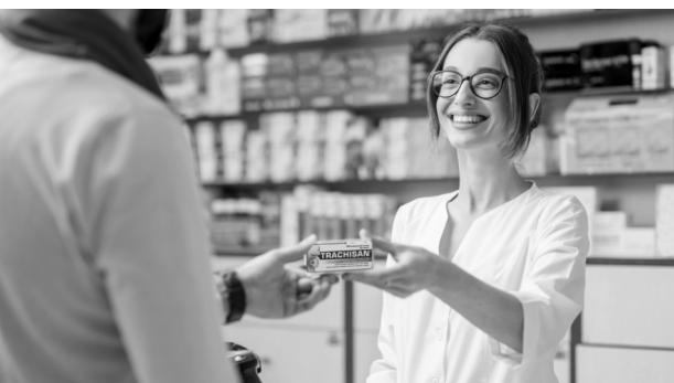
Уз осмех и лек

ЦИНСКО СРЕДСТВО МОЖЕ СЕ ПОДИЋИ У ЦИВИЛНОЈ АПОТЕЦИ” и оверава својим потписом и печатом војноздравствене установе, односно јединице или установе Војске Србије.