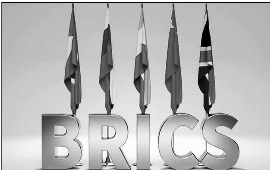
Земље оснивачи БРИКС-а

Самит земаља БРИКС-а у Јоханесбургу у Јужној Африци (одржан 22. до 24. августа 2023) био је скуп посебно значајан за јачање улоге земаља у развоју у обликовању ново, праведног и инклузивног поретка. Пријемом нових чланица (Египта, Етиопије, Саудијске Арабије и Уједињених Арапских Емирата), БРИКС је удвостручио своје чланство и отворио пут свом даљем ширењу. Јасно је да се не ради само о географском ширењу, иако је и оно само по себи нови квалитет и показатељ дубинских промена, већ много више, о незадрживом јачању глобалне улоге и утицаја формата БРИКС +