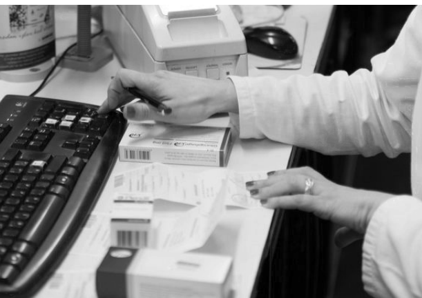
У ери дигитализације лакше је пословање