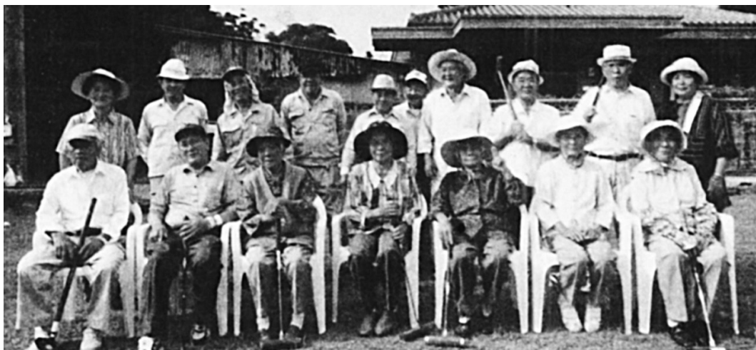
Федерација клубова старијих грађана Огимија на Окинави 1993. Прогласила је своје село најдуговечнијим у Јапану

Прва заједничка „моћ“ ових заједница јесте да живе у окружењу које их