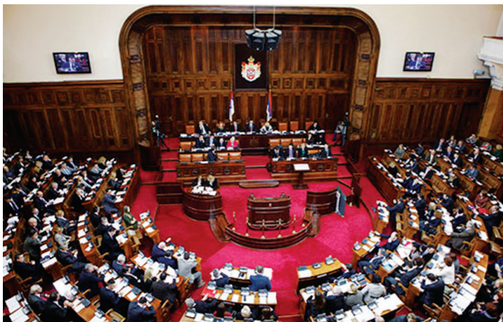
Поглед на велику салу