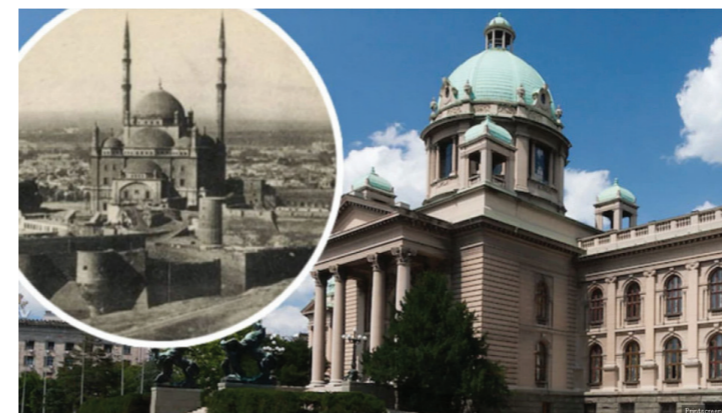
У првој половини 19. века овде се налазила Батал џамија, једна од најлепших турских џамија у Београду.

курса који би предвиђао изградњу скупштинске зграде у националном стилу. Династичка смена 1903. године и доношење новог Устава, којим је Народна скупштина поново постала једнодомна, нису утицали на измене пројекта који је израдио Јован Илкић. Ипак одређени политички проблеми, попут Царинског рата одложили су почетак градње, која је почела тек 1907. године. Полагање камена темељаца одржано је 27. августа (9. септембра) 1907. године, у присуству краља Петра I Карађорђевића и престолонаследника Ђорђа, народних посланика и дипломатског кора. Повеља која је том приликом узидана у темеље садржала је имена краља, митрополита, и главних архитекте Јована Илкића.