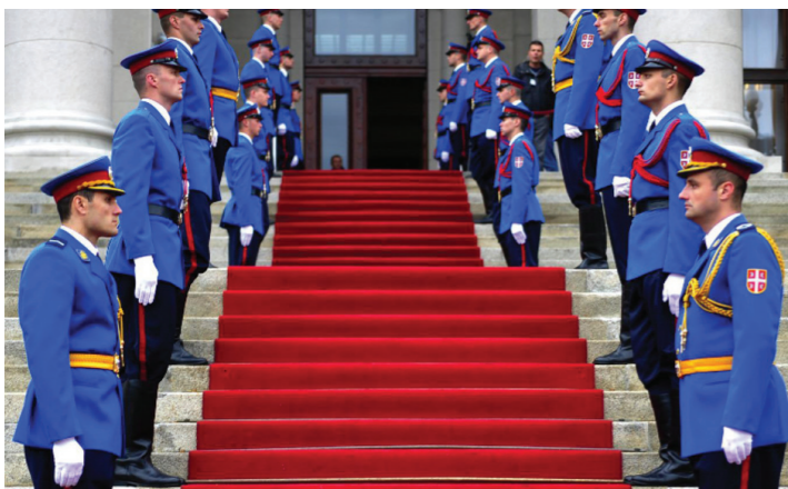
Почетак заседања Скупштине обавља се уз почаст гарде

Дом Народне скупштине Републике Србије је објекат на тргу Николе Пашића у Београду. Та институција је, од 1936. до 1945. године, изворно позната под називом Скупштина Краљевине Југославије. Године 1945. је преименована у Савезну скупштину. Нов назив се одржао кроз времена постојања СФРЈ и СРЈ. После нестајања Државне заједнице Србије и Црне Горе, 23. јула 2006. године овај Дом постаје званично здање Народне скупштине Републике Србије.