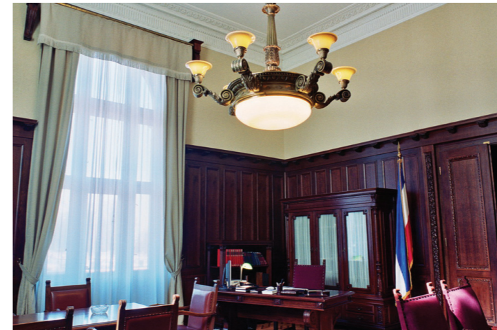
У једном од кабинета