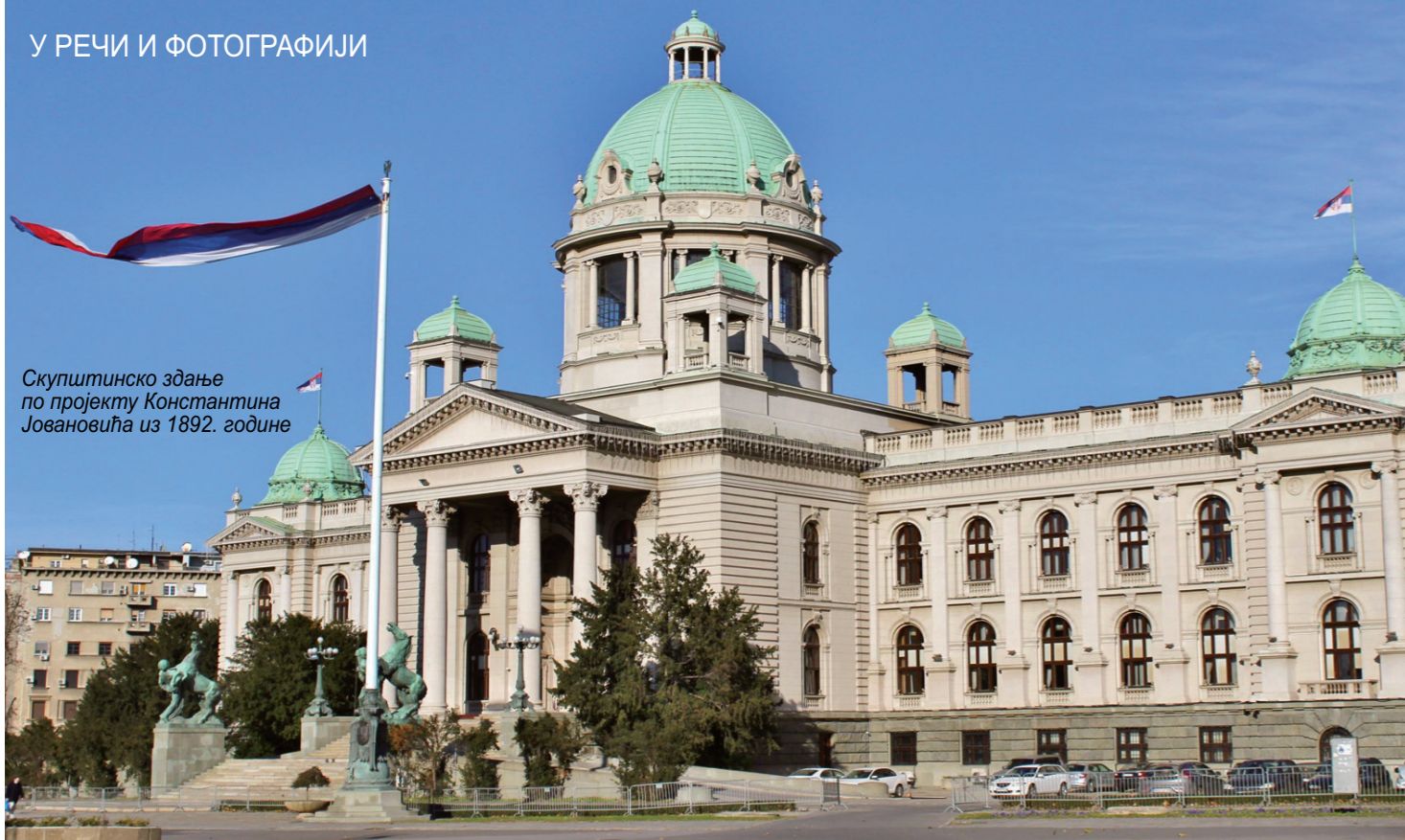
Скупштинско здање по пројекту Константина Јовановића из 1892. године