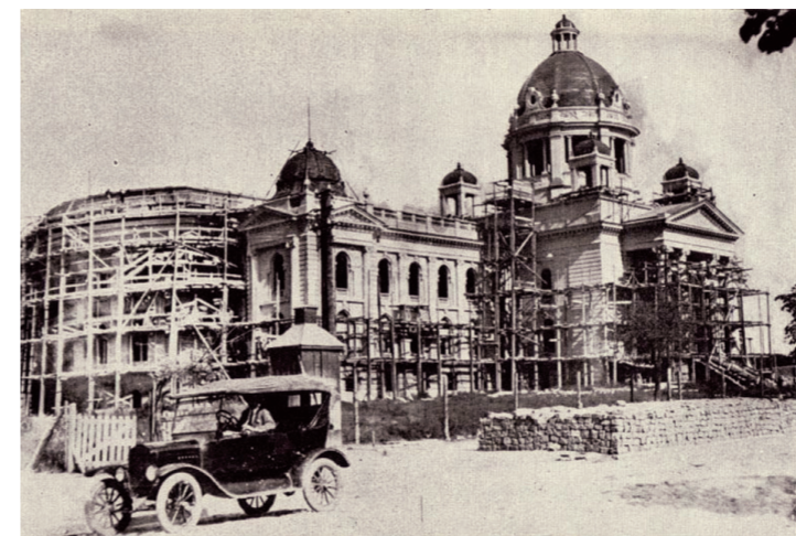
Изградња парламента је трајала веома дуго, скоро 30 година. Камен темељац је 27. августа 1907. године положио краљ Србије Петар I Карађорђевић