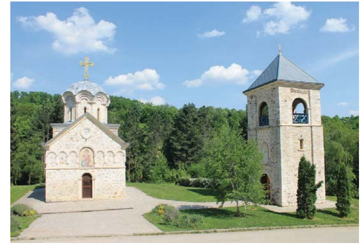
Фреске у манастиру Старо Хопово