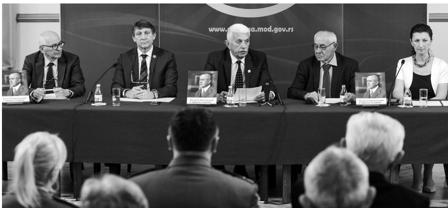
Србија се није у довољној мери одужила Милутину Миланковићу