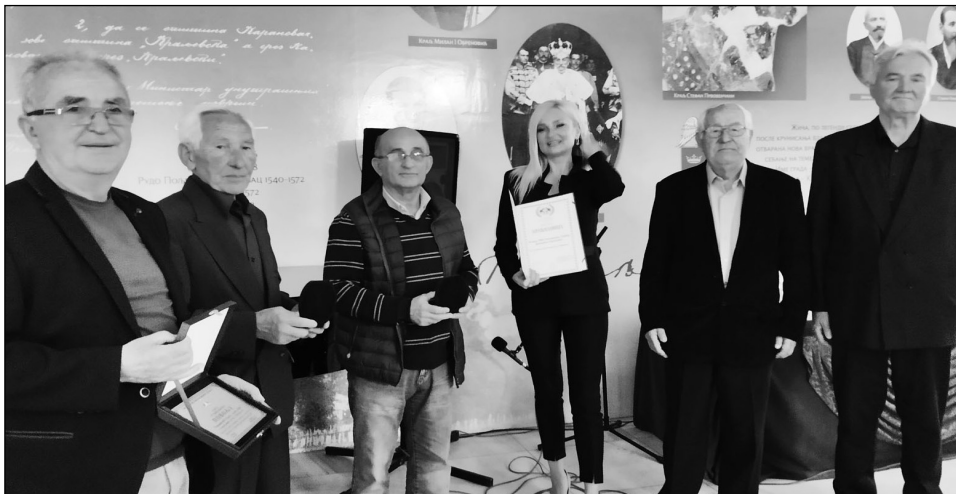
Добитници признања УВПС