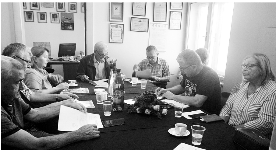
Делегати Скупштине земунских војних пензионера

Бројно стање КВП се сваке године смањује због природног одлива, а и неевидентирања одласка у пензију активних припадника система одбране