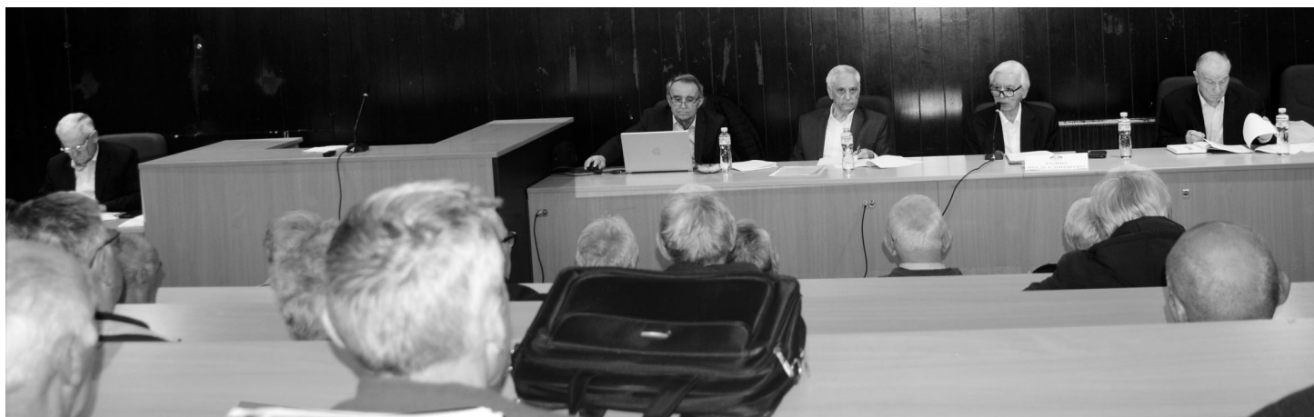
Радно председништво је добро обавило свој задатак

Делегати месних одбора УВПС, отворено и аргументовано, говорили су о проблемима који тиште војне пензионере, предлажући могућа решења. Остварени резултати, како су оценили, обавезују, а тежишни задаци опредељују активности чланова за наредни период.