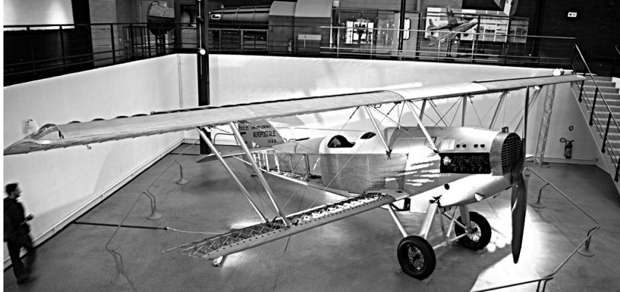
Потез 25 само један од типова авиона на којима су обучавани наши пилоти

У периоду између два светска рата, за потребе војног ваздухопловства формиране су три пилотске школе за обуку војних пилота и њихово усавршавање (за основну пилотску обуку у Новом Саду и Мостару и за обуку пилота ловаца у Земуну). Школе су биле у саставу ваздухопловних пукова до децембра 1937. године, када су ушле у састав новоформиране Команде пилотских школа, мењајући при том називе. Пилотска школа 1. вазд. пука у Новом Саду променила је тада назив у Прву пилотску школу, Пилотска школа 7. ваздухопловног пука у Мостару у Другу пилотску школу, а Пилотска школа 6. ваздухопловног пука у Земуну у Трећу пилотску школу. Штаб Команде пилотских школа био је у