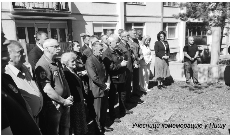
Учесници комеморације у Нишу