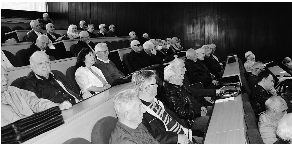
Седници Скупштине присуствовало је 98 одсто делегата