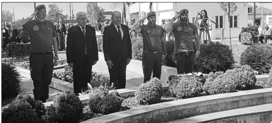
Ветерани 125. моторизоване бригаде

„Изложба је после Београда дошла управо у Ниш и то је важно. На једној од слика приказан је збор у Орашцу, где су се наши преци окупили и донели пресудну одлуку о отпочињању борбе против дахија и Османске империје. Али захваљујући једном великом српском проблему, неслози, пламен слободе који је обасјао некадашњи Београдски пашалук, дошао је надомак Ниша, до брда Чегар. И када је требало да уђе у сам Ниш, неслога је завладала српским војводама, непријатељ се консолидовао, довео појачање и задао тежак ударац у боју на Чегру. То је Ниш и Нишлије коштало чекања од дугих 69 година да би осетили светлост слободе. Мислим да је јасно колико је важно да будемо сложни“, рекао је министар Селаковић.