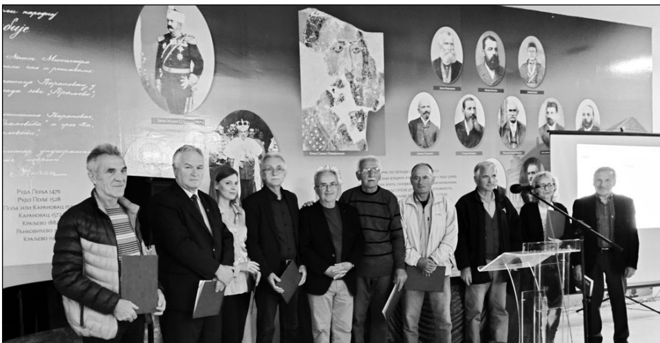
Појединци и организације које је наградила краљевачка организација УВПС

сти, нема право на банковни кредит. Најповољније би било да се станови додељују по постојећим ранг-листама и важећем правилнику. Такав предлог је надлежним органима доставио Главни одбор УВПС.