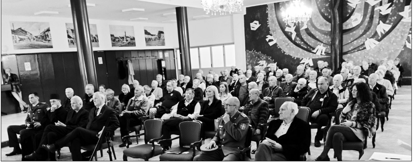
Поглед на салу где је одржана седница