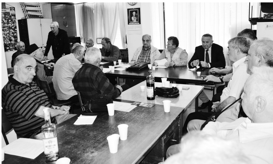
Учесници седнице су покренули неколико проблема који их тиште.

Све што траже војни пензионери своди се на поштовање Устава и закона