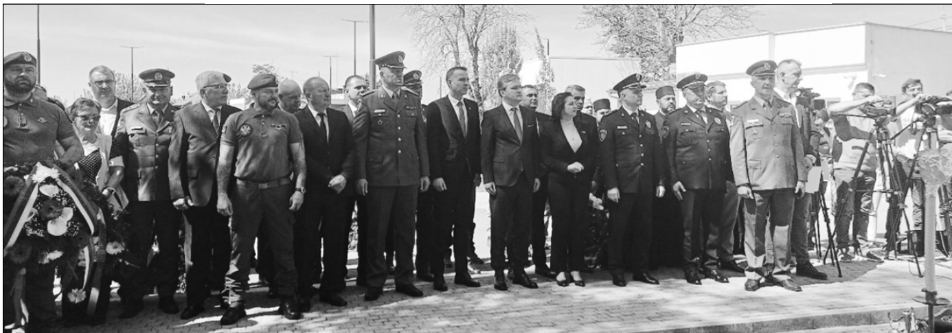
Учесници комеморативног скупа