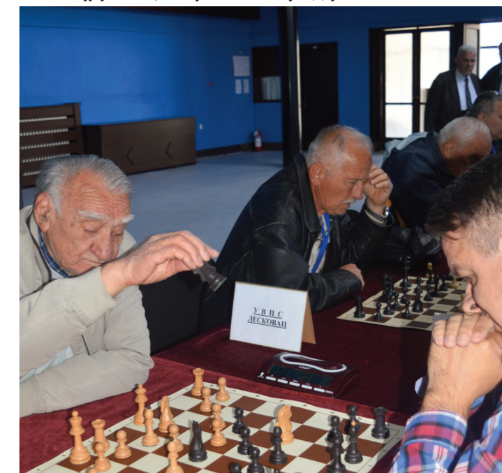
Од сваког потеза зависи успех