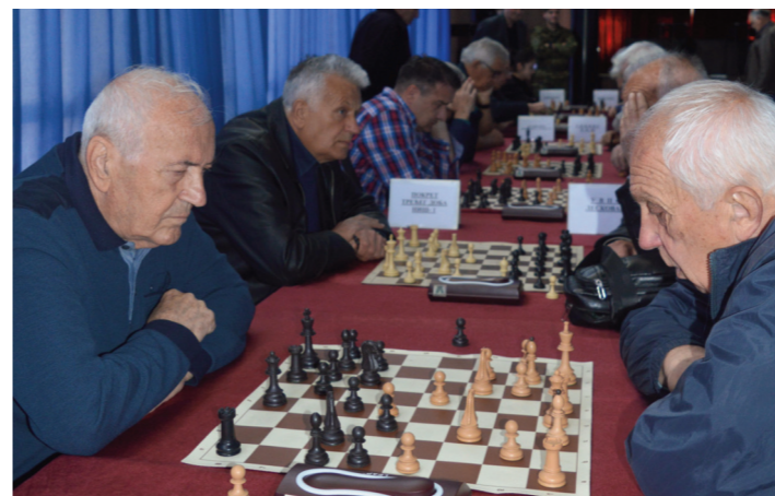
Озбиљна лица све говоре

удружењу се размењују лепе речи, а оне често недостају. Лично ће, како је подвукла, понети лепу успомену на дан у којем се одвијао турнир. Пожелела је такмичарима сваку срећу, поручивши им да имају разлога да се радују животу.