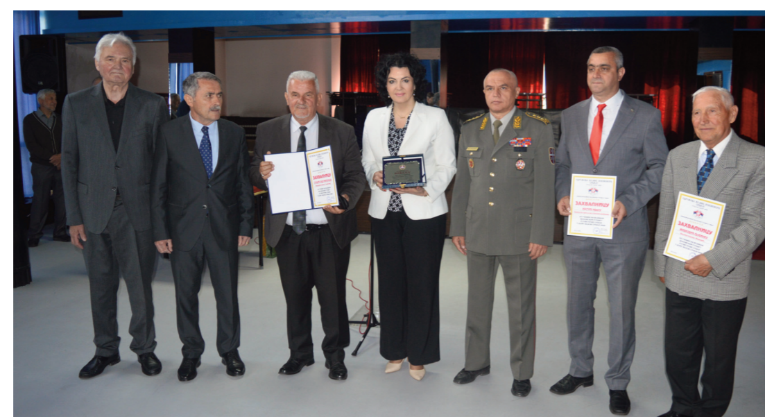
Заједнички снимак добитника признања