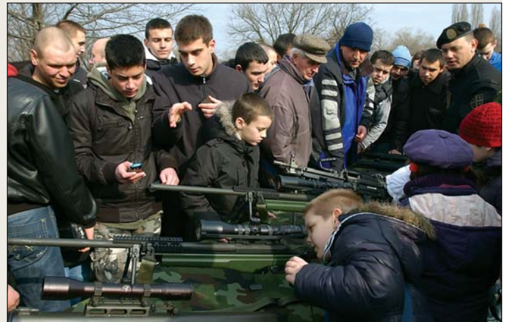
На тактичко-техничком збору, у оквиру изложбене поставке вежбе "Ушће 2011", изложена су средства и опрема јединица Војске Србије