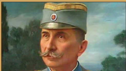
Урош Предић: Портрет војводе Петра Бојовића