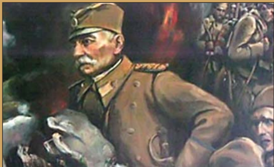
Михаило Миловановић: краљ Петар I у рову