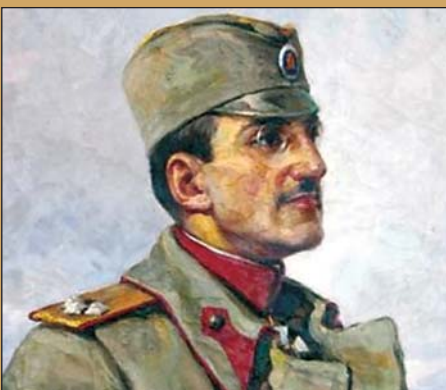
Всеволод Константинович Гуљевич: портрет регента Александра Карађорђевића