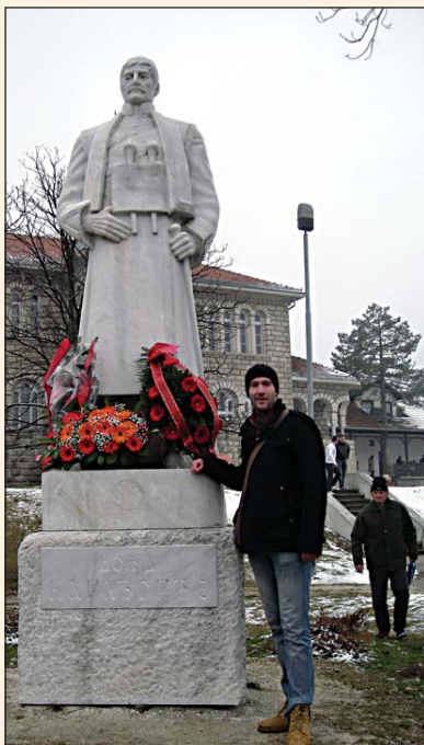
Венце и цвеће у Марићевића јарузи и крај споменика Карађорђу положили су бројне невладине организације, удружења која негују традиције ослободилачких ратова Србије, као и бројни грађани.