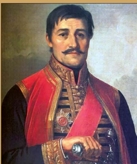
Урош Предић: портрет војводе Карађорђа