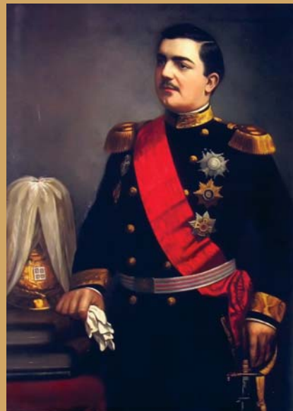
Феликс Турнашон Надар: портрет Михаила Обреновића