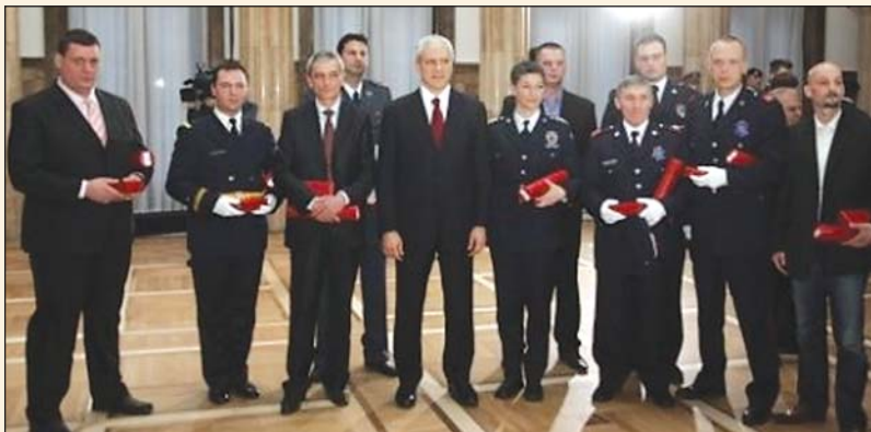
Председник Србије Борис Тадић доделио је, у оквиру прославе Дана државности, медаље за храброст "Милош Обилић"