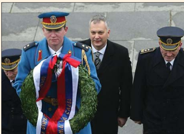
Изасланик председника Републике Бориса Тадића, министар одбране Драган Шутановац, положио је венца на гроб Незнаног јунака на Авали